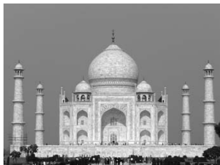
Агра. Тадж Махал

и любящих женщин. Смягчали этот образ воинственный нрав раджей, или вдохновлял простых воинов и крестьян преодолевать трудности суровой жизни?