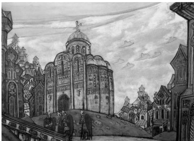
Н.К. Рерих. Путивль. Декорации к опере «Князь Игорь». 1914

строителей. В конце концов, романское искусство породило готический стиль, который своим устремлением к небесам придал архитектуре вид почти невесомый.