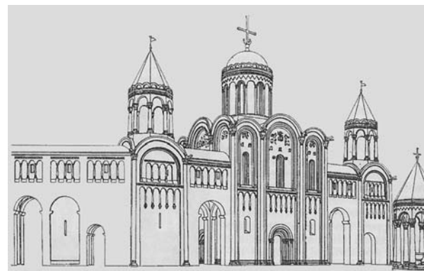
Боголюбово. Резиденция князя. Реконструкция

На высоком берегу Нерли, недалеко от Владимира, расположен другой памятник архитектуры — резиденция князя Андрея Боголюбского (1111–1174) — Боголюбов-город. Когда-то здесь были построены мощные крепостные стены и дивной красоты храмы. Была в них своя особенность, указывающая на иноземное влияние. О таких влияниях Н.К. Рерих писал: «Иноземная рука не кривит русский творческий путь» [2, т.III, с.378]. Великий художник не устаёт повторять это везде, где заходит речь о чужеземных влияниях в русском искусстве. «Русский народ никогда не болел скверною болезнью шовинизма. Не боялся иноземцев, ибо сам знал своё