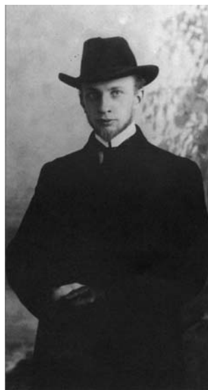
И.А.Ильин. 1910-е годы