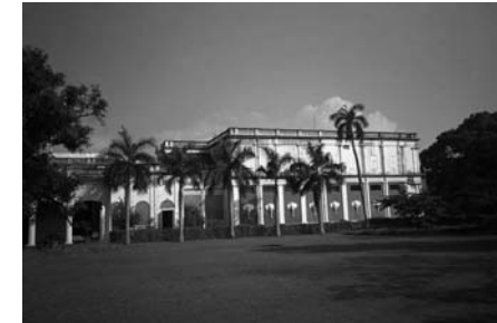
Адьяр. Штаб-квартира Теософского общества

В этом очерке не ставилась цель передать документально точно обстоятельства и события, географические данные и исторические факты. Задача поставлена другая — поделиться ощущением, попытаться разглядеть вездесущее чудо жизни. Всю дорогу нас сопровождают необычные вспышки осознания. То вдруг вспоминается увиденный много лет назад сон, то балансируешь на грани миров, словно всё происходящее уже когда-то случилось, а тебе остаётся только запечатлеть события здесь и сейчас. Или, пробираясь сквозь нагромождения памяти и мучительных переживаний, неожиданно является