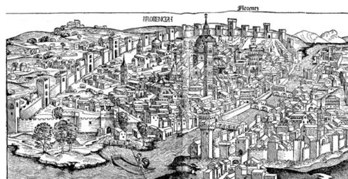
Панорама Флоренции. 1493 год

Также у Данте можно найти символические указания на общие для всех форм Единого Учения положения: справедливое посмертное воздаяние в соответствии с мерой