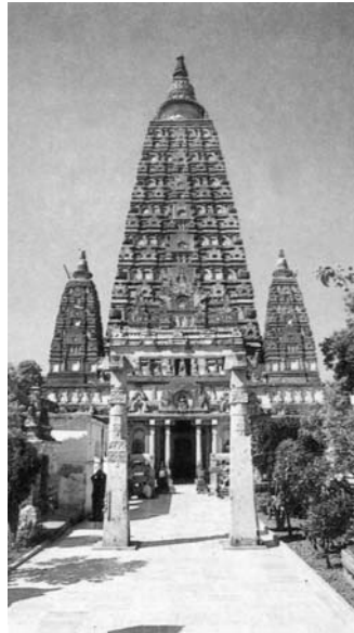
Бодхгайя. Место просветления Гаутамы Будды

обиход в центр мира, свои трудности кажутся жалкой мелочью, а своя судьба уже видится удачным сочетанием внешнего и внутреннего. Безусловно, Индия учит уже одним своим присутствием на планете, учит и помогает осмыслить своё назначение среди многообразия мироздания. Тем временем наша дорога поворачивает строго на восток, мимо погребальных костров Варанаси мы направляемся в священный для каждого буддиста город. Бодхгайя построен вокруг дерева, под которым размышлял, достиг просветления и учил Благословенный Владыка Будда. В складках этой древней земли всё ещё хранится память о Его удивительном пути, о произнесённых Им словах и о Его молчании. Сквозь толстые наслоения прошлого всё же можно ощутить дыхание тех времён. Сейчас буддизм многолик, пластичен, многонационален и противоречив, но продолжает быть самой терпимой и философской мировой религией. Вдуматься только, сколько людей окрылил и вдохновил, направил и научил одинокий и величественный Странник Сиддхартха Гаутама. Недалеко от Бодхгайи сохранились грандиозные развалины Наланды, одного