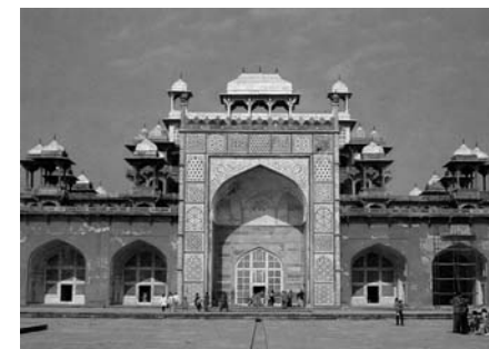
Сикандра. Усыпальница Акбара

Построенный Акбаром Фатехпур-Сикри, город Победы, и сейчас одерживает победу над временем. Сердцем его был и остаётся загадочный мраморный ларец — небольшой мавзолей учителя и друга императора,