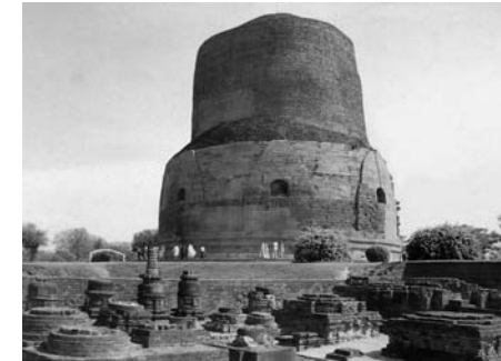
Сарнатх. Большая ступа

В Индии учит всё. Железная дорога, продавец мармелада, пожилая женщина с миской для подаяния. А вот и Калькутта. Невероятный масштаб перенаселённости. Подавляет, но и восхищает. Находим долгожданный Белур Матх, Миссию Рамакришны на берегу реки на окраине города. Матх — это монастырь, а Миссия — это действенное служение, они составляют единую и мощную организацию, чьи филиалы есть по всему миру. Основание их было положено Вивеканандой здесь, в Белуре. Впечатляет в первую очередь храм, он как призыв к согласию и объединению человечества. На берегу