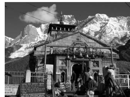
Кедарнатх. Истоки Ганги

Наблюдаем за жизнью в большом, наполненном пылью и суетой городе, за людьми, привычно двигающимися среди дикого шума, тесноты и ветхости. Улыбки, любопытные сценки, невозмутимые лица, смешные и нелепые, красивые и печальные. Такие же люди, как и мы, но всё же чуть другие, пропитанные древней культурой, непонятными правилами и необычной для нас религиозностью. Благодаря таким наблюдениям перестаёшь ставить себя и свой