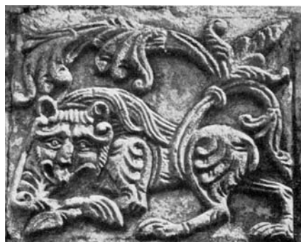
Рельеф Георгиевского собора. Фрагмент

богатством и своеобразием стилизации. Какое-то другое, более существенное по глубине определение заслуживает этот стиль, выросший из жизни, как чудесная сказка импровизации хожалого баяна. Звериность не будет внутренним признаком этого стиля. Его художественное благородство и богатство просят какое-то более выразительное определение. Наверное, такое определение, а может быть, и не одно, будет найдено по мере накопления новых открытий» [2, т. I, с. 71]. Присутствие этого стиля не обусловлено какими-то ритуалами, а «широко разлилось по всей жизни, укрепляя и дальнейшее воображение к подвигам бранным и созидательным» [2, т. I, с. 71]. И это особенно хорошо видно на примере храма Юрьева-Польского. А приглядевшись к манере исполнения, мы увидим и новые, присущие только русским мастерам черты — мягкость и задушевность такая, что хочется сказать: не «звери», а «зверушки». Это уже совершенно русская декоративность, перешедшая от дерева к камню. Её нетрудно заметить и на русском металлическом литье.