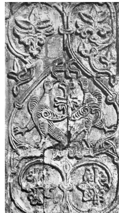
Юрьев-Польской. Георгиевский собор. Фасадная резьба

Для искусства «сокровищем Азийским» является так называемый «звериный стиль», который «состоит из