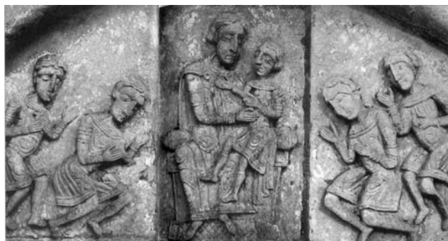
Владимир. Дмитриевский собор. «Всеволодово гнездо»

в Суздальском ополье 1 , отчего и называется он Польской. Здесь находится последнее завершающее создание владимирских мастеров, которое символично сочетает начало и конец их великого и стремительного в своём движении творчества. Это Георгиевский собор , «зело чудный», украшенный резным камнем от подошвы и до верха. Резьба словно «обтягивает» архитектурную конструкцию. Существенным техническим и художественным новшеством Георгиевского собора является соединение изображений высокого рельефа с тончайшим ковровым орнаментом. Плоскостной растительный орнамент сочетается с горельефными фигурами святых, зверей и всевозможных фантастических изображений. Ласковые, почти улыбающиеся львы лежат, скрестив лапы, к ним очень бы подошла надпись: «се лев, а не собака». Диковинные птицы,