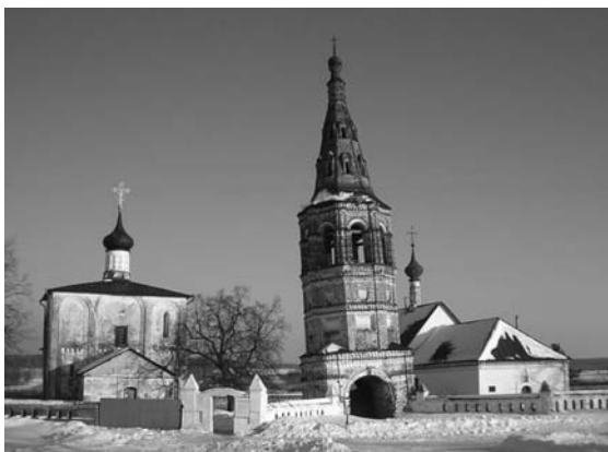
Кидекша. Борисоглебский монастырь. XII век

всё славные места! И уместно привести слова Н.К. Рериха: «Почему древние любили жить в таком приволье? Не только в стратегических и других соображениях тут дело, а хорошо жил и хорошо чувствовал древний. Если хотел он раскинуться свободно, то забирался на самый верх местности, чтобы в ушах гудел вольный ветер, чтобы сверкала под ногами быстрая река или широкое озеро, чтобы не знал глаз предела в сияющих заманчивых даях. И гордо светились на все стороны белые вежи» [5, с.19].