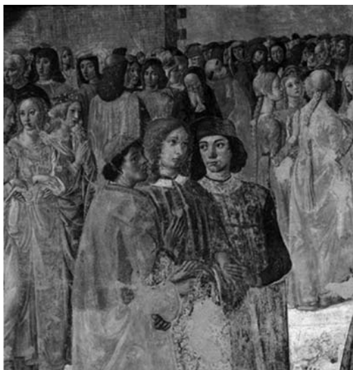
Козимо Росселли. Шествие епископа мимо церкви Св. Амвросия. Фреска. XV век. В центре — представители Флорентийской Платоновской академии: Марсилио Фичино, Пико делла Мирандола и Анжело Полициано

В Законе Моисея и восходящей к нему Каббале Пико обнаруживает общий корень и герметизма, и каббалистики еврейских учёных, и греческой философии — в особенности Пифагора и Платона, а также и христианства. В этом едином корне и хочет Пико найти основу для всеобщего согласия.