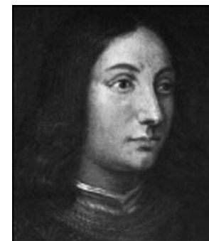
Пико делла Мирандола

анства, чем иудаизма; он открыл в ней доказательства учения о Троице, Воплощении, Божественности Христа, небесного Иерусалима, падения ангелов”, и тому подобное. “В 1486 году, когда ему было всего двадцать четыре года, он опубликовал 900 тезисов, которые были расклеены в Риме <...> и которые он обязался защищать в присутствии всех европейских учёных, приглашённых им в “Вечный Город” с обещанием оплатить им все их расходы на путешествие. Среди этих тезисов был и следующий: “Никакая наука не предоставит большего доказательства божественности Христа, чем магия и Каббала”» [4, с.598].