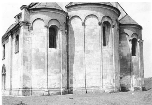
Галич Волынский. Церковь Св. Пантелеймона. 1200 г. Единственный сохранившийся памятник галицкой архитектуры

как раньше, призвать мастеров из враждебного ему Киева. За помощью в строительстве Юрий Долгорукий обратился к Галицкому князю Владимирко Володаревичу (1104–1152), с которым у него была дружба. Через галицкие земли, смыкающиеся с Польшей и Венгрией, шёл путь в Западную Европу. В Галиче во всём ощущалось дыхание Запада, и в строительстве тоже. Польские и венгерские мастера строили из белого камня храмы и замки, техника эта была уже достаточно хорошо освоена. Юрий пригласил галицких мастеров к себе в Залесье. И если кладка из камней была для Залесья делом новым, то с каменной резьбой, скорее всего, освоились быстро, имея вековые навыки резьбы из дерева.