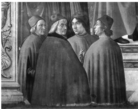
Доменико Гирландайо. Захария в храме. Фреска в соборе Санта Мария Новелла, Флоренция, 1486–1490. (Фрагмент).

Изображены философы Флорентийской Платоновской академии Марсилио Фичино, Кристофоро Ландино, Анджело Полициано и Джованни де Бекки