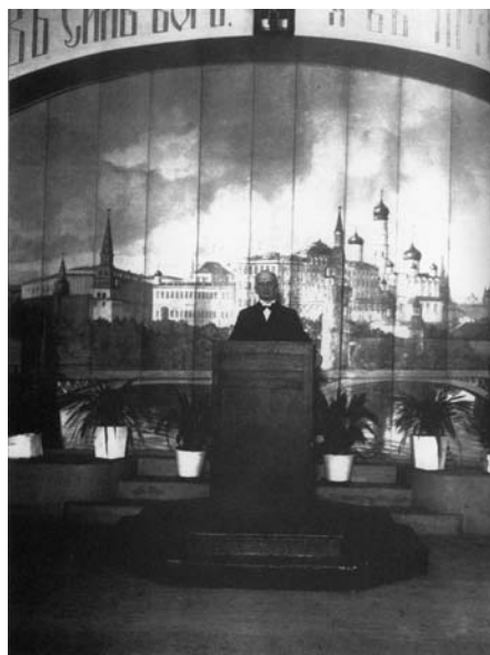
Югославия. Лекция в кадетском корпусе. Бела Црква, 1934

существования в сферу подлинного, метафизически-реального бытия . Здесь межа, здесь великая грань. <...> Это грань между душой и духом» [16, т.VII, с.466–467].