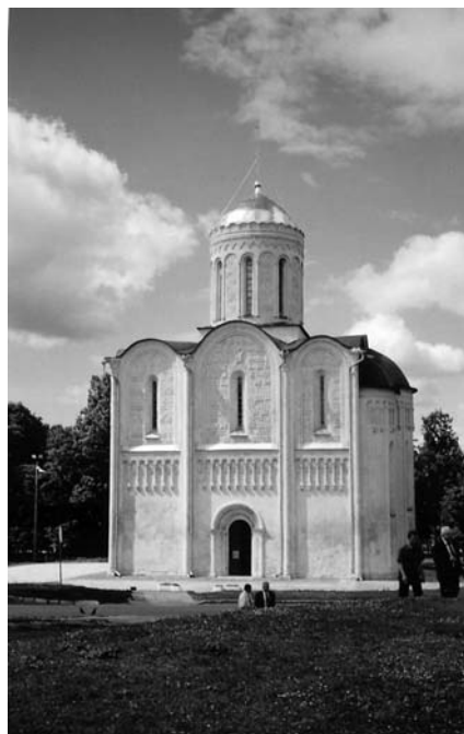
Владимир. Дмитриевский собор.

го на троне библейского царя и пророка Давида. В руках он держит арфу, называемую «псалтырь». Отсюда и название одной из самых любимых на Руси книг для чтения — «Псалтырь» — книги псалмов Давидовых, последние строки которой говорят: «Все сделал Ты премудро, земля полна произведений Твоих. Все дышащее да хвалит Господа!» [Пс.150]. Вокруг Давида собралась вся тварь земная и небесная: барсы, львы, грифоны, а также птицы-сирины, кентавры и единороги. Здесь же и героические персонажи — Александр Македонский, поднимаемый орлами, Самсон, поражающий льва, царь Соломон, Геракл.