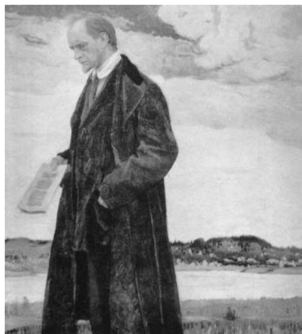
М.В. Нестеров. Мыслитель. 1921–1922

И этой основе он был верен до конца. Именно благодаря этому его творения находили столь живой отклик во многих сердцах.