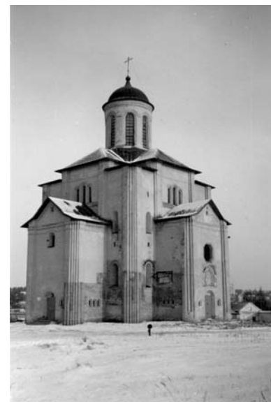
Смоленск. Храм Архангела Михаила. Конец XII века.

Вторая половина XII века — эпоха расцвета культуры Владимирской Руси. Духовный импульс устремления к единству — в противовес дробившим страну княжеским междоусобицам, определил и блестящее развитие архитектуры и искусства. По всей Руси вместе с основанием новых городов строятся и новые каменные соборы. С конца X до начала XIII века их было поставлено приблизительно 250. Из них девять — во Владимиро-Суздальской земле, которая досталась младшему сыну Владимира Мономаха