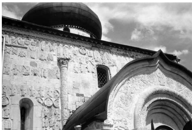
Юрьев-Польской. Георгиевский собор. Фрагмент.

пластики. Это архитектурный шедевр, выполненный из белого камня.