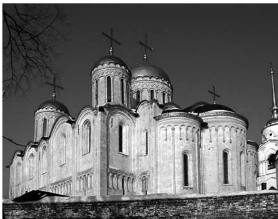
Владимир. Успенский собор

маски, сюжетные композиции. Эта резьба по камню начинала играть важную роль в оформлении владимирских храмов.