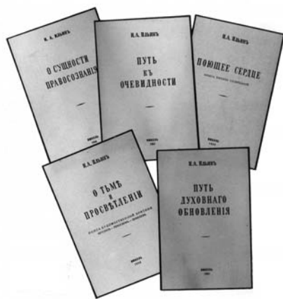
Книги И.А. Ильина

где радость и где истина» [5, ч.1, §96].