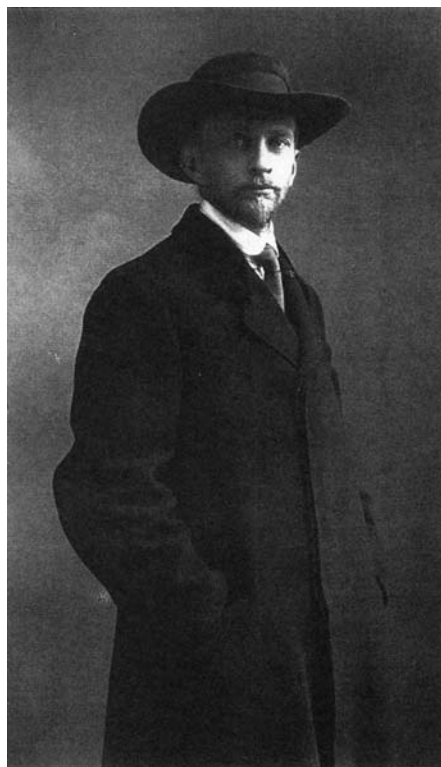
Перед высылкой из России. 1922

историю философии («Философия Гегеля как учение о конкретности Бога и человека»), эстетику («Основы искусства. О совершенном в искусстве»), литературоведение («Русские писатели, литература и искусство», «О тьме и просветлении. Книга художественной критики. Бунин — Ремизов — Шмелёв»), политическую философию и правосознание («О монархии и республике», «О сущности правосознания»). В 1948 году в ответе