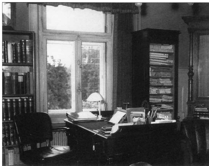
Кабинет Ильина в Цолликоне, Швейцария

(«почитаемые, дивные, высокие духом иконы» и исполненные глубокого содержания фрески) — это тема для отдельного исследования. Здесь мы коснёмся его художественных установок применительно к светскому, «мирскому» искусству.