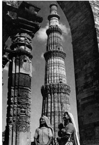
Дели. Башня Кутаб Минар

удушающих объятий базарно-вокзального Дели, можно побывать в удивительных местах этого почти вечного города. Приходит сознание причастности к многообразному и противоречивому миру Востока, как гармоничного, так и хаотичного. Рядом с ажурным остриём Кутаб Минара есть красивые старинные ворота, где на каменных истёртых скамьях можно ощутить безостановочное шествие древней и современной цивилизации. Уви-