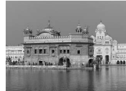
Амритсар. Золотой храм

Мы едем в Куллу. Чтобы запечатлеть в кратких строках всё благословение и умиротворение этого места, надо обладать талантом японского поэта Басё. Вспоминаются предрассветные лучи, рассекающие небо на радужные части. Свежее дыхание ветра в лицо, когда идёшь по дороге через маленькие деревни, куда-то вверх. Взгляд на усадьбу Рерихов со знаменем триединства на фасаде. Бегущие в школу дети. Скрип половиц на веранде. Нелегко сразу осознать, что именно здесь, за этим небольшим столом было написано столько вдохновляющего и