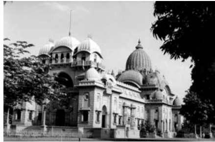
Калькутта. Белур Матх

широкой Ганги он подобен пришвартованному кораблю, на котором уплывут лучшие из людей. Рядом дом, где прошли последние дни Вивекананды, откуда он тоже ушёл в своё нескончаемое плавание. На другом берегу ушли Рамакришна, Сарададеви, Шивананда, и многие вслед поплыли вверх по течению, опережая своё время. А величественный храм Белура стоит надеждой на спасение и просветление. «Стоит ли бояться умереть, пытаясь осознать своё подлинное “я”?» — воскликнул однажды Вивекананда [2, с.98].