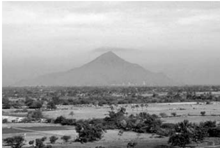
Священная гора Аруначала

Просто в путешествии всякое событие проступает более отчётливо.