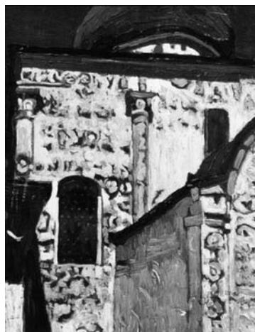
Н.К. Рерих. Юрьев-Польской. Георгиевский собор. 1903

именно из тех, что напечатаны без указания имени фотографа. Хотя здесь же означены работы замечательного фотографа И.Р. Барщевского, архитектора Ф.Ф. Горностаева и самого И.Э. Грабаря.