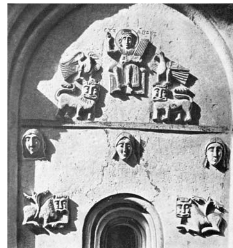
Фасадная скульптура храма Покрова на Нерли

Завершает Дмитровский собор высокий барабан, украшенный скульптурными изображениями наиболее священных образов — здесь наряду с фигурами птиц