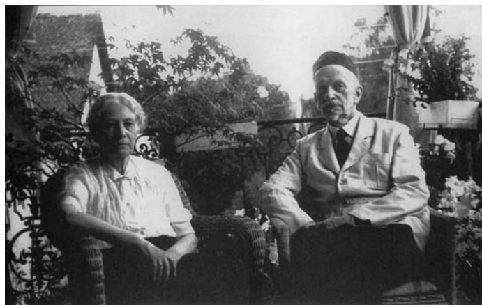
И.А. Ильин и Н.Н. Ильина. Цюрих, 1954

Гений творит всегда в лоне национального духовного опыта. Каждый народ по-своему созерцает Бога и по-своему вынужден решать стоящие перед ним задачи, оставаясь верным своим святыням. Исторически русский народ доказал, что умеет создавать в глубинах духа свой невидимый «град Китеж». «Народ, обитающий на пространствах равнины, вдохнул в себя нечто безмерное» [16, т.VI, ч.III, с.171]. Но его воля получает свой размах только тогда, «когда она что-то любит»; её невиданная удаль разворачивается только тогда, когда эта любовь в основе своей религиозна, то есть устремлена к слиянию с высшим, Божественным миром. Просторы народной души и всеоткрытости таят в себе великие возможности, но и немалые опасности — остаться «незаселённой, беспредметною» или погрузиться в «хаос всесмещения». Родоначальник прекрасных форм, «пригвождающий и сковывающий своим светом хаос» [16, т.VI, ч.III, с.214] — Пушкин — смог в художественном прозрении, умении «в истине блаженство находить», наполнить русскую душевную свободу и пророчески указать стране её ведущую цель — «жить божественными содержаниями».