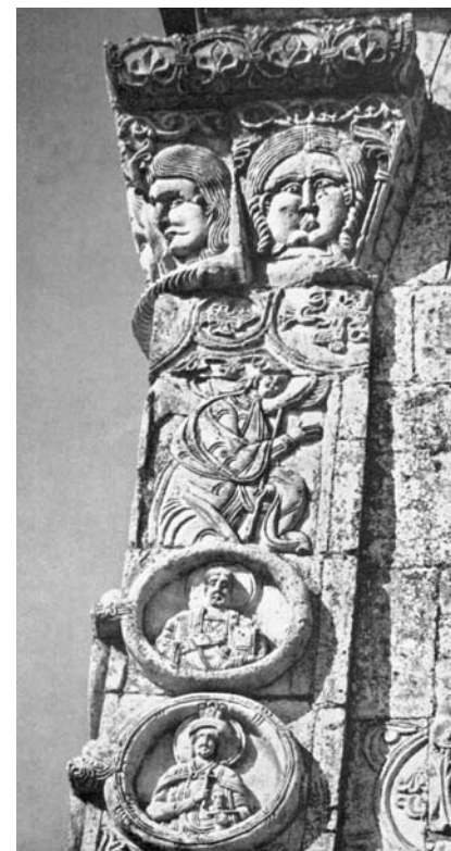
Юрьев-Польской. Георгиевский собор. Фасадная резьба

Белокаменное зодчество Владимиро-Суздальской Руси можно рассматривать не только как отдельный исторический эпизод расцвета искусства, но и как великий духовный импульс, посланный в будущее непреходящий культурный магнит, собирающий всё лучшее для воплощения в грядущих веках. Россия — не только страна