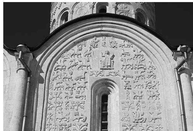
Владимир. Дмитриевский собор. Фрагмент горельефа

Целый пояс из двенадцати всадников на стене собора представляет святое воинство Христово. В других настенных изваяниях угадываются черты первых русских святых Бориса и Глеба, Фёдора Стратилата, Фёдора Тирона. С трёх сторон храма, среди всех рельефов, в центре мы снова видим фигуру сидяще-