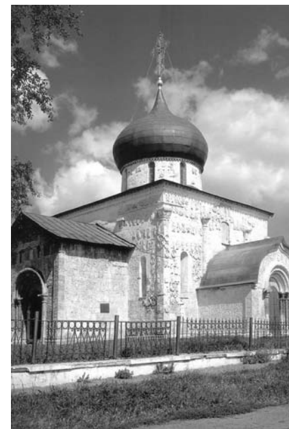
Юрьев-Польской. Георгиевский собор.

переплетаясь хвостами и шеями, словно прислушиваются к чему-то. А кентавры, а всевозможные чудища из неведомо каких краёв — видно, что без азиатского влияния здесь не обошлось. Есть даже слон, но сразу понятно, что человек, исполнявший портрет этого экзотического животного, только слышал о нём, так забавно этот слон выглядит. У слона заячьи уши, ведь это самые большие уши, какие знает русский человек, лапы, похожие на медвежьи, а хобот, загибающийся