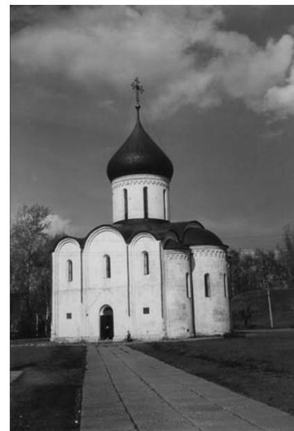
Переславль-Залесский. Спасо-Преображенский собор.

С моста через Нерль открывается прекрасный вид на весь ансамбль целиком. Невольно воскликнешь: какие