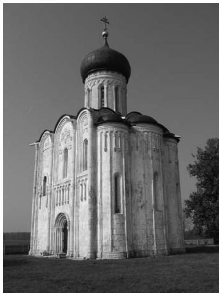
Боголюбово. Храм Покрова на Нерли

мечательном памятнике И.Э. Грабарь в своей «Истории Русского искусства»: «Наиболее изящная из них, церковь Покрова на Нерли близ Владимира, является не только самым совершенным храмом, созданным на Руси, но и одним из величайших памятников мирового искусства. Как все великие памятники, Покров на Нерли не передаваем ни в каких воспроизведениях на бумаге, и только тот, кто видел его в действительности, кто ходил в тени окружающих его деревьев, испытывал обаяние всего его неопишимо стройного силуэта и наслаждался совершенством его деталей — только тот в состоянии ценить это подлинное чудо русского искусства» [9, т.I].