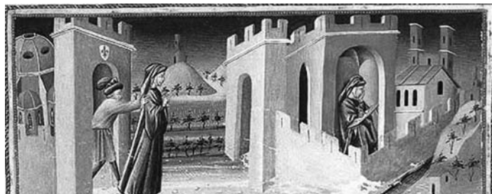
Джованни ди Паоло. Данте, изгнанный из Флоренции. (Иллюстрация к Раю Данте). 1445

по-гречески означает «пламенный». Также и характеристики этой сферы, приводимые в «Божественной Комедии», сближают его с Миром Огненным. Это сфера, в которой царят Божественная Любовь и Свет. В Эмпирее не имеют силы ограничения пространства и времени: «Там близь и даль давать и брать не властны» [БК. Рай, XXX, 121]. Это обитель огненных существ, называемых в христианстве ангельскими сонмами, а также наиболее чистых и праведных душ.