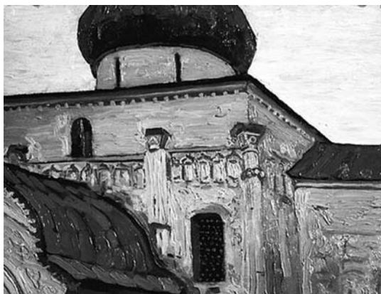
Н.К. Рерих. Юрьев-Польской. Георгиевский собор. 1903

И шло это от желания своими руками ощутить «времен связующую нить». Отсюда поездки Рериха за стариной. Вот сделанный самим художником неполный перечень мест, по которым он прошёл.