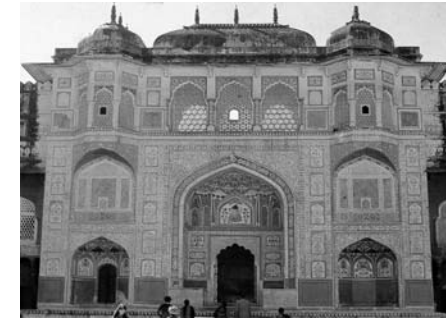
Раджастан. Форт Амбер

Невероятная сила пронизывает даже случайного путешественника, не оставляет его равнодушным. Глаза детей, улыбки женщин, взгляды мужчин — всё здесь по-особому необычно. Орлиные гнёзда свирепых воителей, гордые башни победителей, молчаливый прах осуждённых. Раджастан — это гимн независимости. И что удивительно, именно здесь особо почитают Кришну в образе пастуха — юного мирного Кришну в окружении заботливых