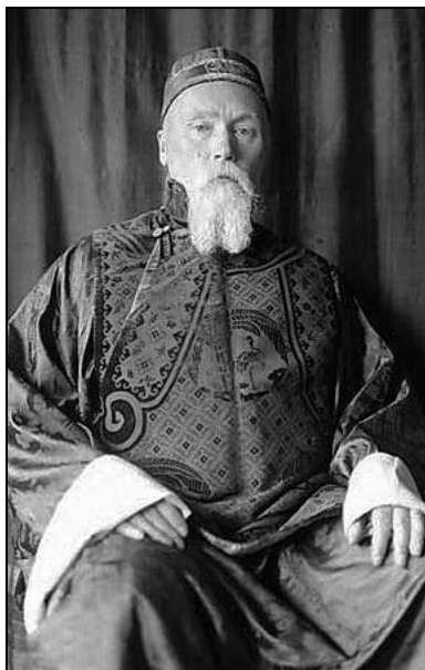
Николай Рерих в одежде Ивана-Царевича с мечом. Извара. СПб. губерния. 1890- гг.; Н. К. Рерих в восточном костюме. Кулу. Индия. 1930-е гг.