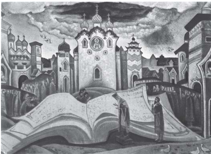
Голубиная книга. Худ. Н.К. Рерих