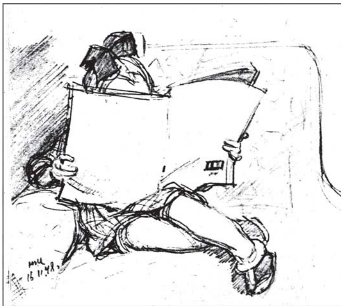
Воскресенье. Худ. Н.Н. Жуков.