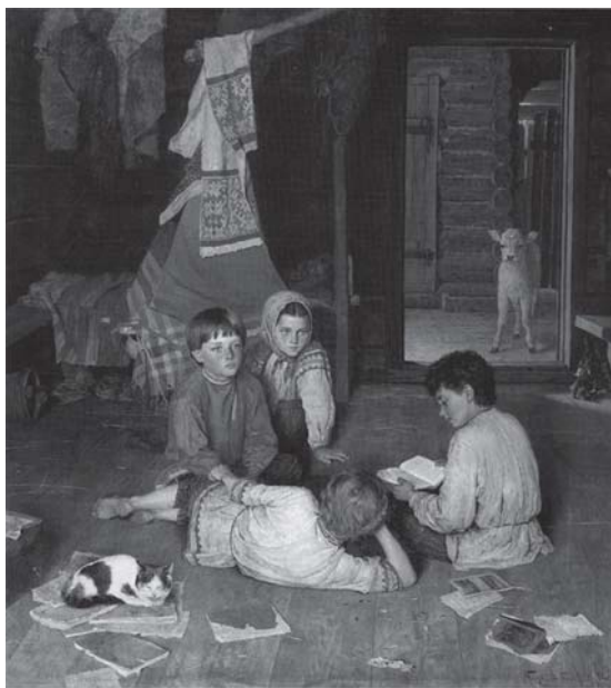
Новая сказка. 1891 г. Худ. Н. Богданов-Бельский.

«Важным для нас окажется и портрет К. И. Головачевского с воспитанниками Академии (1811), написанный "отцом" русского бытового жанра А. Г. Венециановым. Престарелый профессор Академии художеств обращается с наставлением к своим юным воспитанникам. На коленях у него книга, в ней как бы заключены знания, которыми должны овладеть будущие художники. Новая тенденция в портрете чувствуется и у ученика Венецианова И. Т. Хруцкого (см.: "Семейный портрет", 1854)».