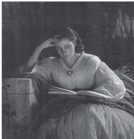
За чтением. Портрет С.Н. Крамской. 1863 г. Худ. И.Н. Крамской