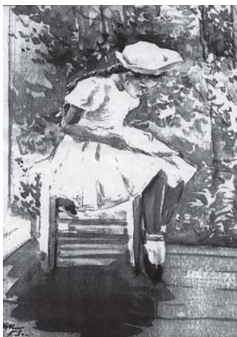
Рис. художника Н.Н. Жукова