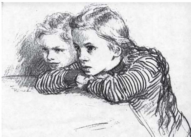
У телевизора. Худ. Н.Н. Жуков.

Как уже отмечалось, чтение играет важную роль в развитии воображения . Именно это нужно учитывать, подходя к выбору книг и рекомендуя что-либо прочесть детям, подросткам, юношеству. То же можно сказать и о работе в Интернете, а также о выборе материалов для просмотра видео-, теле- и кинофильмов. Учитывая их способность сильно воздействовать на сознание, нужно проявлять большую осторожность в рекомендациях и бережность, чтобы воображение не развивалось в сторону безобразия. Необходимо иметь в виду, что воображение требует воспитания, его надо образовывать .