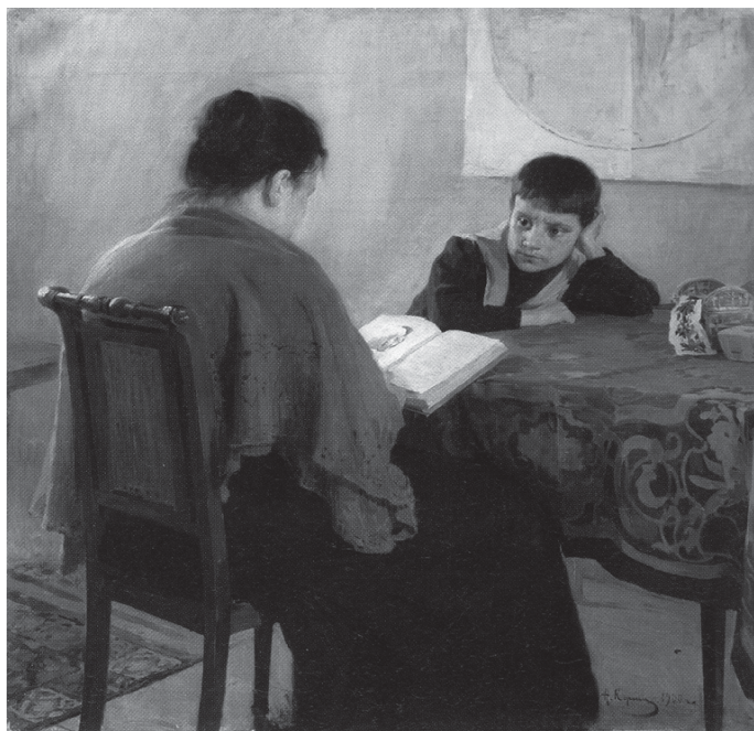
За книгой (Увлекательное чтение). 1900 г. Худ. А. Корин.