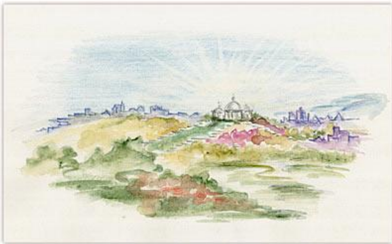
Рис. 2. Храм Истины. Художник И. Савинова

В настоящее время в быту истина часто выступает аббревиатурой. Например, под истиной НИИ механики МГУ понимается «Интеллектуальная Система Тематического Исследования Научно-технической информации».