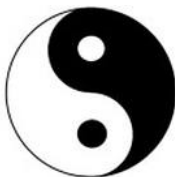
Рис. 3. Знак Инь-Ян