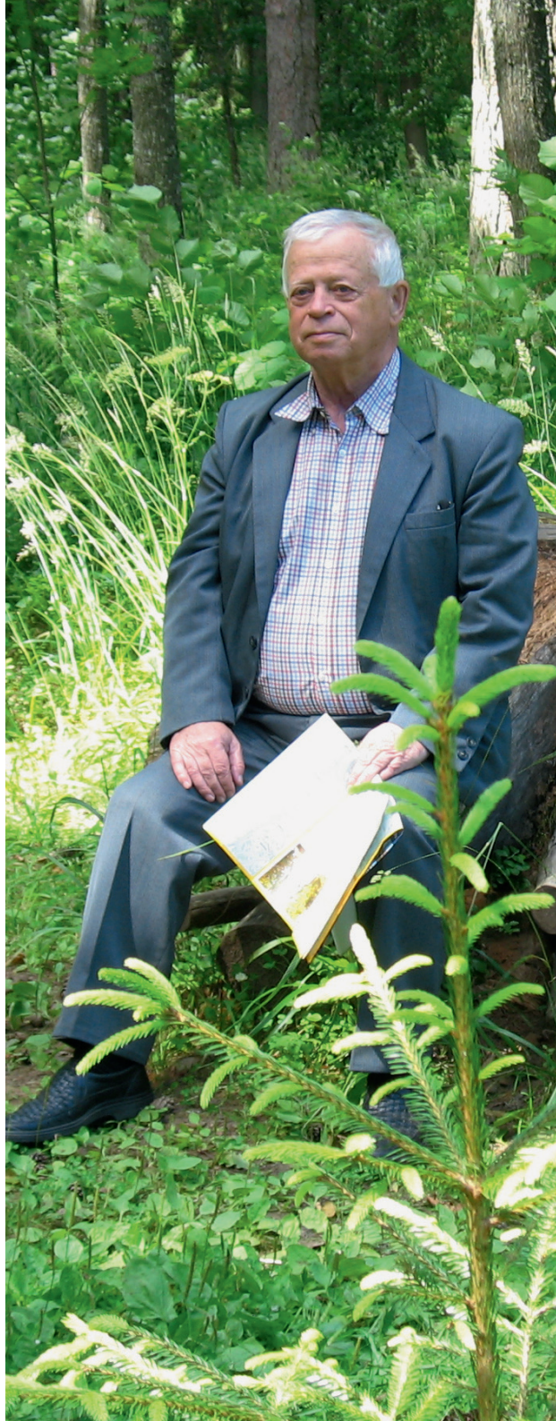
200-летие К. Маркса и грядущее 150-летие В.И. Ленина

Президент Ноосферной общественной академии наук, вице-президент Петровской академии наук и искусств, председатель Санкт-Петербургского отделения и Философского Совета Русского Космического Общества, академик Российской академии естественных наук, Европейской академии естественных наук, Международной академии психологических наук. Заслуженный деятель науки РФ. Лауреат Премии правительства РФ. Полковник в отставке. Доктор философских наук, доктор экономических наук, кандидат технических наук, профессор. Автор более 1300 научных и публицистических работ, в том числе автор и соавтор более 380 книг, брошюр, монографий. Издается 13-томное собрание сочинений автора под общим названием «Ноосферизм». Опубликовано 10 томов. Глава научных школ по ноосферизму, синтетической квалиметрии, системогенетике, социогенетике и теории циклов, философии истории. Им разработаны: основы неклассической социологии, теория капиталократии и глобального империализма, концепция закона энергетической стоимости и специфических законов развития российской цивилизации, теория ноосферного социализма, концепция научно-образовательного общества, философия управляющего разума или общественного интеллекта, ноосферизм как целостная научно-мировоззренческая система.