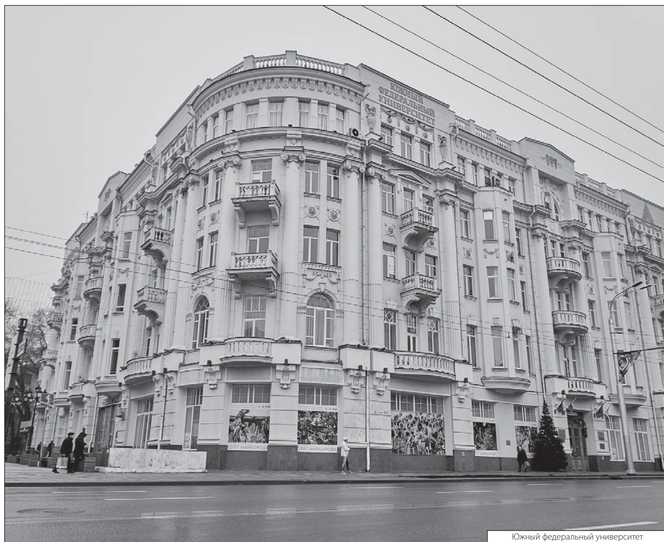
Южный федеральный университет

Журнал «Современная наука: актуальные проблемы теории и практики»