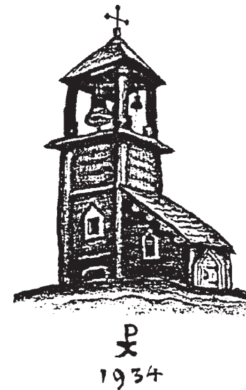
Н.К.Рерих. Эскиз звонницы в Бариме

У Живой Этики и Православия ныне общие задачи в борьбе с западной бездуховностью и потребительством, сатанинскими культурами и всякими постмодернистскими псевдокультурными игрищами, разлагающими сознание россиян. Живая Этика и Православие — объективные союзники, ибо стоят по правую руку от Христа, а носители их истин, желающие сегодня бескорыстно служить России, должны сознательно и свободно единиться в Духе и жизни, дабы устоять перед невиданно изощрённым натиском мирового зла.