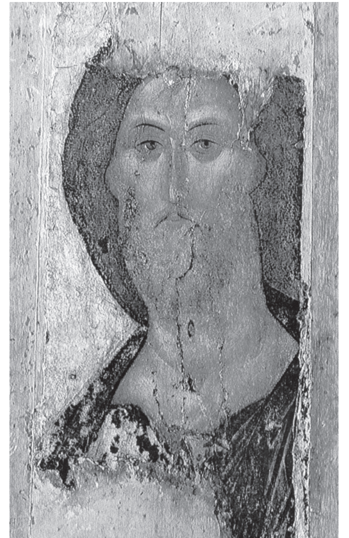
Андрей Рублёв. Спас. Из Звенигородского чина. Начало XV в.

Спас – Милостивый, Спас – Кроткий, Спас – Всеведущий, Спас – Всемогущий, Спас – Грозный, Спас – Всеисцеляющий, всё тот же Великий Лик, полный бездонной мощи, к которому извечно приходят люди со всеми радостями, горями, болезнями и причитаниями.