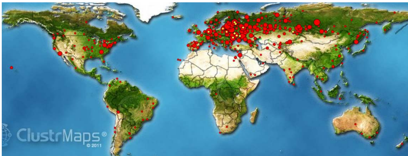
Рисунок 2.- Карта заходов на сайт Института Культуры ДонНТУ. Самый малый круг – до десяти человек в месяц из данного региона. Самый большой круг – более 1000 человек/месяц из этого города/местности.

об этом докладывали в Государственной Эрмитаже РФ осенью прошедшего года [18]. Каждый ВУЗ и профессор, и просто творческий человек, не равнодушный к будущему своей страны, может найти место в институте культуры ДонНТУ. Многие страны мира заходят на сайт и смотрят видео-программы института культуры ДонНТУ (см. рис. 2).