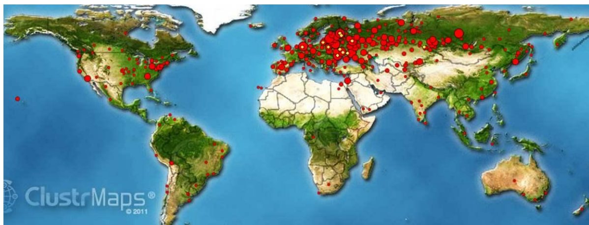
Рис. 2. Карта заходов на сайт Института Культуры ДонНТУ. Самый малый круг – до десяти человек в месяц из данного региона. Самый большой круг – более 1000 человек/месяц из этого города/местности.

С программой, библиотекой, дистанционными курсами, конкурсами знакомьтесь на сайте Института Культуры ДонНТУ [19].