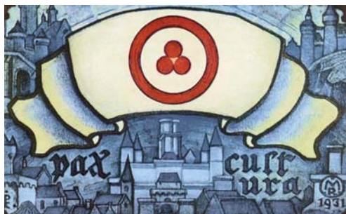
Н.К. Рерих. Пакт Культуры (Знамя Мира)

В 1935 году при подписании Пакта Мира – «Договора об охране художественных и научных учреждений и исторических памятников» – Знамя Мира, по предложению всемирно известного художника и общественного деятеля Николая Константиновича Рериха, было утверждено как отличительный знак защиты культурных ценностей. Это Знамя имеет на белом фоне в круге три соединенные амарантовые сферы как символ Вечности и Единения (единство прошлого, настоящего и будущего в кольце Вечности; или – синтез искусства, науки и религии в круге общечеловеческой Культуры).