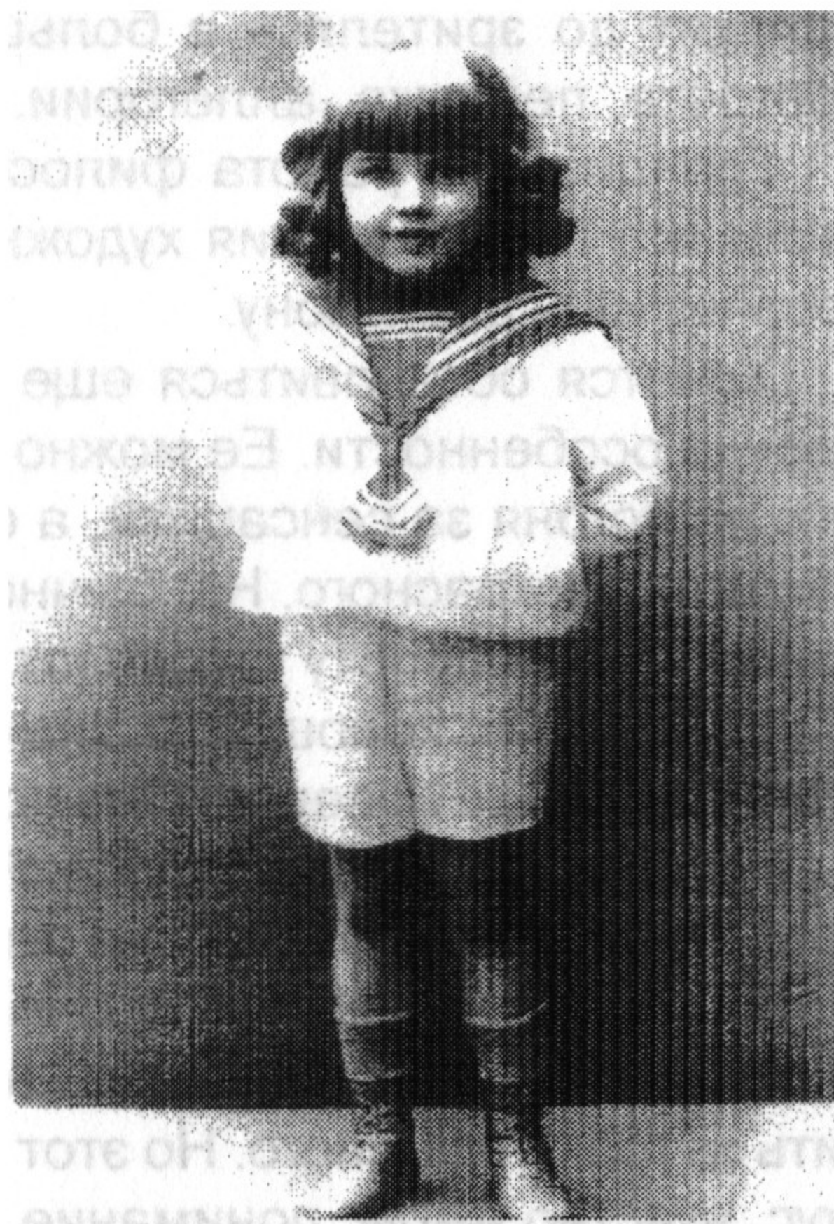
Святослав Рерих в детстве

Ласточка водится, если говорить по всему свету, но это не очень точно, потому что не везде ласточка бывает. Ласточка – птица перелетная, то есть она у нас не зимует, а улетает в Африку. Летом же с появлением теплых солнечных лучей мы вновь слышим ее веселое щебетание. Как весело ласточка вьется под облаками, в солнечный день она ловко ловит насекомых, вредных для хозяйства, полей, лесов и огородов. Вообще ласточки приносят неисчислимую пользу для человека, избивать ее грех. Вьет она свои гнезда как придется, но чаще всего начинает их вить в мае и кончает постройку в 2 недели после начала. Ласточка птица веселая, кормит своих птенцов сначала комарами, которых смачивает слюной. Потом, когда