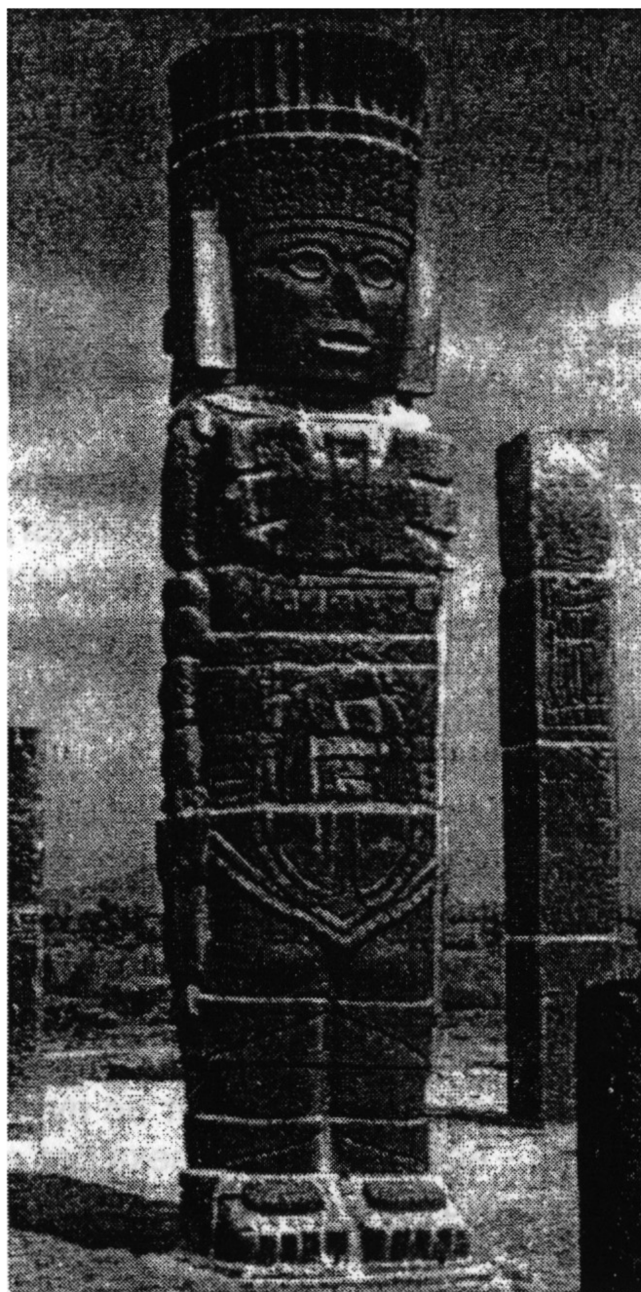
Статуи Тулу (Мексика) изображают, вероятно, древних атлантов.

Как сообщил Кейси, кризис современной цивилизации происходит в значительной степени из-за того, что в