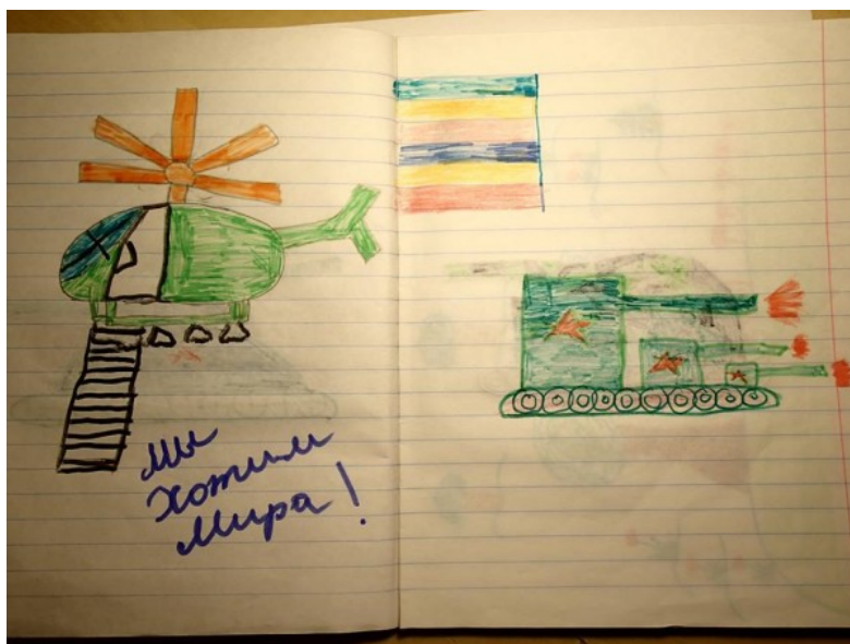
Рисунки из тетради Оли (автора стихов), г. Первомайск