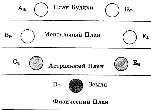
Рисунок 3 - Земная Цепь