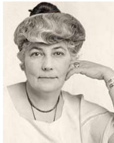
Елена Ивановна Рерих