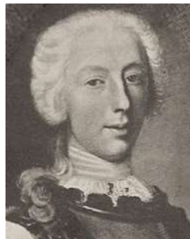
Клод-Луи (де Сен Жермен)

Второй Луч управляется Учителем Кутхуми , Третий Луч Учителем, которого называют Венецианцем . Четвертым Лучом руководит Учитель Серапис , Пятым Лучом Илларион , Шестым Лучом Иисус и Седьмым Лучом – Сен Жермен .