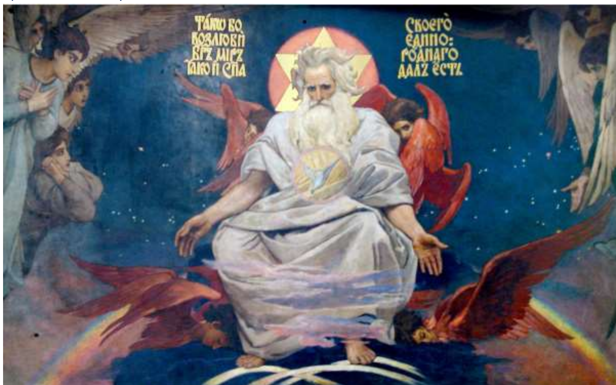
Настенная фреска киевского Собора Святого Владимира

На Девятой Ступени Посвящения САНАТ-КУМАРА или Священный «Король» занимает в сферах планеты исключительное положение на Земле. Он известен также как «Страж Порога» , но Он еще не идентичен Планетарному ЛОГОСУ. Около Него находятся в качестве советников несколько ПРАТЬЕКА-БУДД . О Девятом и еще более высоких Посвящениях человечество не может иметь достоверной информации. Также не имеет смысла дискутировать о высших ступенях Лестницы Иакова, ибо ни один земной человек не способен достигнуть их на протяжении еще многих миллиардов лет. Мы можем иметь связь лишь с ближайшим Звеном Цепи, обойти которое невозможно.