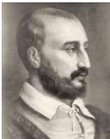
Паоло Кальяри (Веронезе)