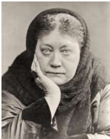
Елена Петровна Блаватская

Женским эквивалентом Архату является Тара. Она - Сестра Белых Братьев. Е.П. Блаватская и Е.И. Рерих уже достигли этой ступени.