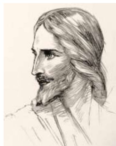
Будда Сиддхартха Гаутама

На Восьмой Ступени Посвящения Учителя Мудрости носят имя Будда . Оно означает «Просветленный» Здесь все Семь Лучей вливаются в Первый Луч Воли и Могущества. Христиане, которые вопреки знанию о том, что Вселенная наполнена мириадами обитаемых Солнц и планет, верят, под влиянием фальшивых догм, что Христос есть единственный Сын Божий во всей Вселенной, будут несколько шокированы, получив представление об истинной Иерархической Лестнице Учителей Мудрости. Им следует сказать, что Христос 5 , как Мировой Учитель Пятой, или Белой Коренной Расы, который в Палестине осенил 6 Ученика своего, Учителя Иисуса , Духом Своим, сам получил, тем временем, Посвящение Будды и был призван к выполнению еще более высокого задания. Поэтому совершенно излишне дискутировать о том, кто из них занимает более высокую ступень. Во всяком случае, в обозримом будущем Христос не вернется в физическом теле на Землю – все спекуляции на эту тему не верны – спустя некоторое время Он окончательно простится с опекаемой Им Пятой Коренной Расой и перейдет к выполнению других Космических Задач.