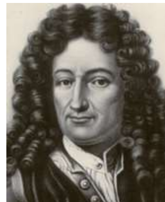
Готфрид В. Лейбниц

Оккультизм учит также, что Монады взяли на себя ведущую и движущую роль в трансмутации материи в дух. Монада не идентична с самим человеком, но является до некоторой степени его руководителем из Высшего Мира, который может лишь частично