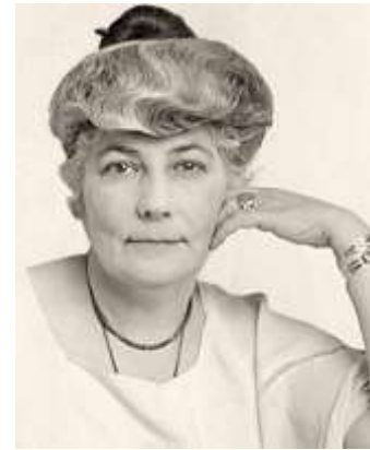
Елена Ивановна Рерих

Ответ: В каждой физической клетке имеется зародыш и ядро, которые соответствуют в человеке огненному зерну и ядру духа. Так огненное зерно в человеке, будучи основой чистого Божественного Начала, остается неизменным и нерушимым в вечности. Ядро духа или высшее Эго в человеке растет и изменяется в беспредельности, при условии, что оно получает нормальное питание от всех центров. То есть, если психическая энергия приводит в действие высшие нервные центры человека. И если человеку, носителю ядра духа, удастся здесь, на Земле, одухотворить свою сущность через открытие своих высших центров, то по окончании цикла, или четвертого круга, нашей планеты, он будет пребывать в соответствующей ему сфере в полном сознании и при всех накопленных им энергиях или способностях. Если и в следующих кругах он проявит ту же неослабную устремленность к совершенствованию, то он точно так же сохранит свое бессмертие и на последующий междупланетный период, и так в беспредельность. Но нужно помнить, что изменения в ядре духа могут происходить как в сторону восхождения, так и в сторону падения. Но невероятно труден подъем после длительного падения. ...” (Письма Е. И. Рерих, 03. 12. 1937)