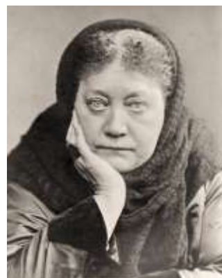
Елена Петровна Блаватская

“Никакого, ни к атому, ни к молекуле, как они существуют сейчас в научном представлении. Она никогда не может быть сравниваема с микрокосмическими организмами, которые были причислены, однажды, к полигастрическим инфузориям, теперь же рассматриваются, как растения, и причислены к водорослям; также она не есть вполне Монас перипатетиков. Физически или в строении своем Минеральная Монада отличается, конечно, от Человеческой Монады, которая не является физической, и строение ее не может быть передано химическими символами и элементами.