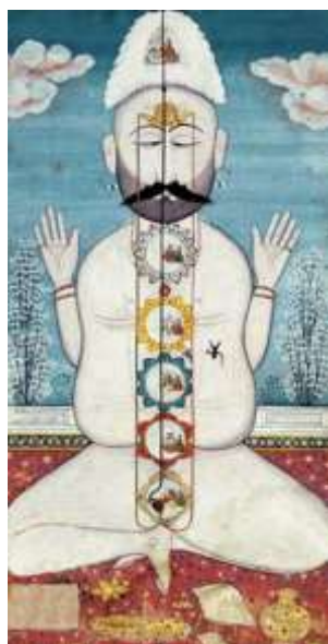
Индийское изображение 18-го столетия. В центре Муладхара начинается энергетический канал КУНДАЛИНИ – कुण्डलिनी

Семь основных чакр, о которых сообщает современная оккультная наука, по терминологии санскрита следующие: