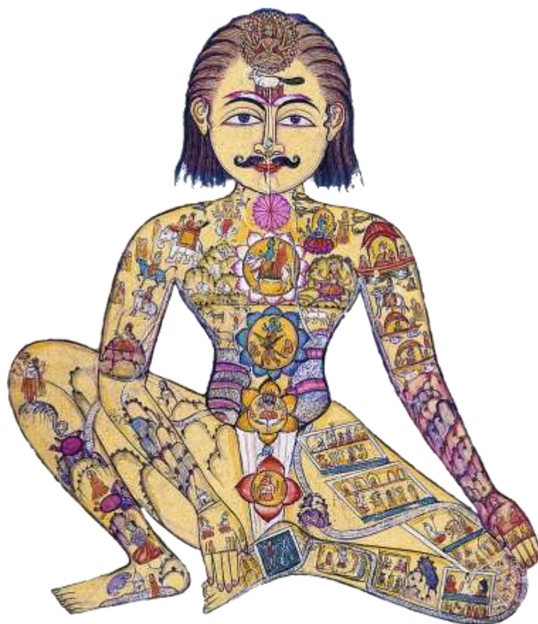
„«Сапта Чакра», манускрипт «Braj-Bhasa» 1899 года.

Чтобы предотвратить пожар центров рекомендуется, прежде всего, покой и отсутствие раздражительности. Однако важнее всего связь с ИЕРАРХИЕЙ СВЕТА и со своим Учителем, руководству которого вы навсегда доверились.