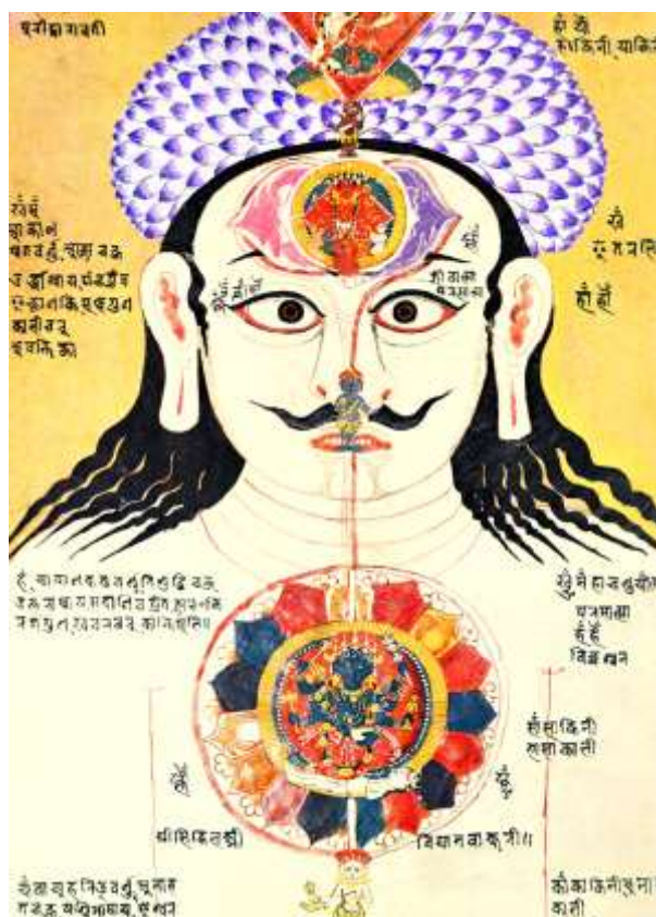
Центр гортани, Третий глаз и колокол, Изображение из Раджастана, 18-ое столетие.

Следующий центр, аджна-чакра, известен как девяностошестилепестковый лотос, его также называют «Глазом Браммы» или «третьим глазом». Он находится на лбу между бровями. Физическим соответствием этого центра является шишковидная железа на затылке. От этого центра зависит гармоничное развитие нашего организма и правильная пропорциональность всех его частей. Путем правильной концентрации на этом центре можно исправлять физические недостатки тела. Открытие этого центра дает, в первую очередь, яснослышание и ясновидение. Под этим подразумеваются не случайные просветы, видимые многими людьми, но осознанное видение прошлых, а также будущих событий, причины которых уже заложены мыслями и идеями. С космической точки зрения возраст этих когда-то заложенных причин может составлять тысячи и даже миллионы лет, поскольку они касаются судьбы планеты.