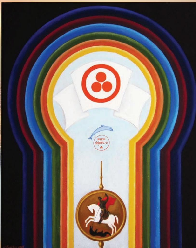
Картина, написанная израильским художником Иосифом Капеляном и подаренная журналу «Дельфис» к 20-летию юбилею