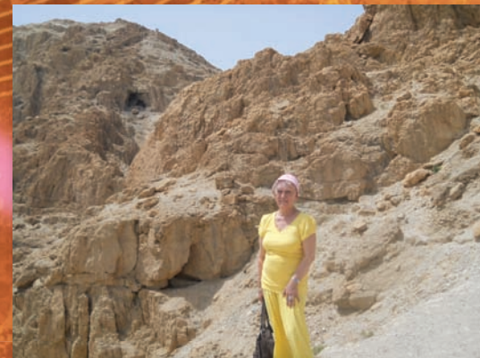
В горах Кумрана