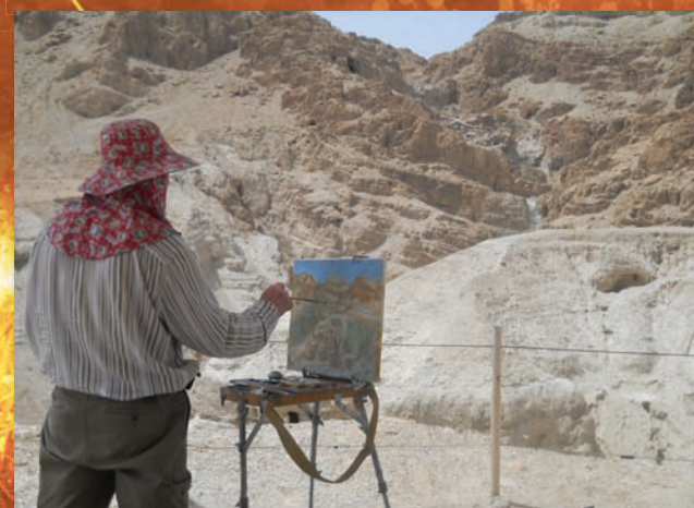
В.В.Надёжин на пленэре