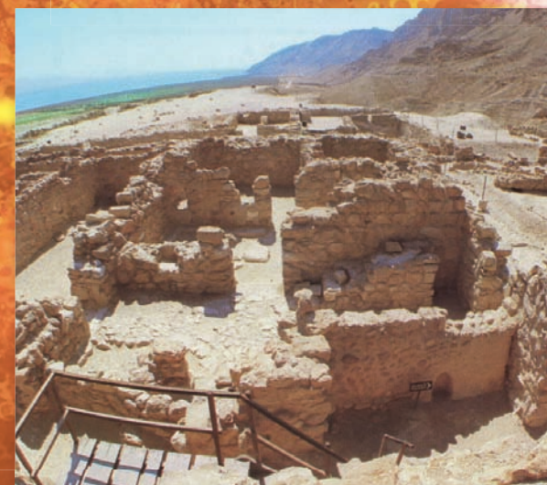
Руины помещения для переписки рукописей