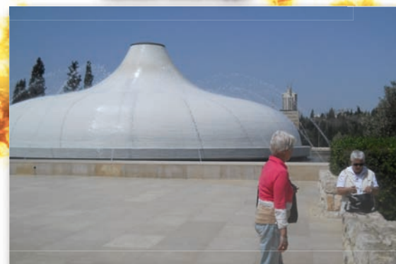
Храм Книги в Иерусалиме