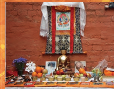
Алтарь, сооружённый буддийскими монахами