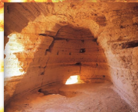
Вход в одну из пещер, открытых летом 1952 года