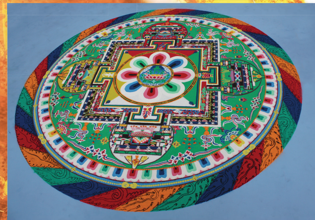
Песочная мандала Зелёной Тары, созданная монахами в Государственном музее «Дом Бурганова»