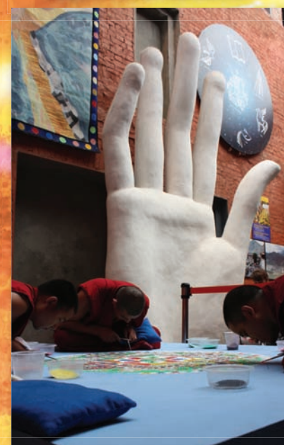
Идёт построение мандалы