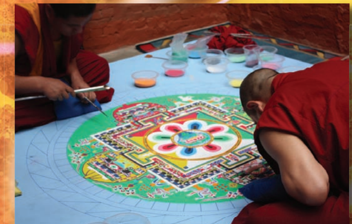
Монахи за работой