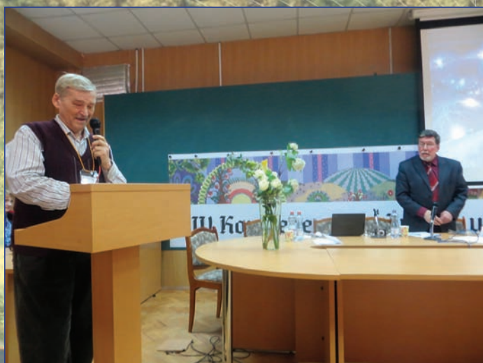
Слово С.Н.Зорину предоставляет В.Л.Правдивцев