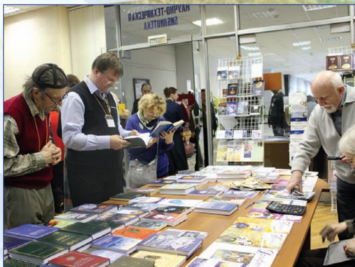
У киоска с книгами