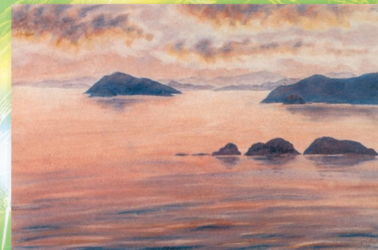
Три слона (из серии «Мир Земле»)