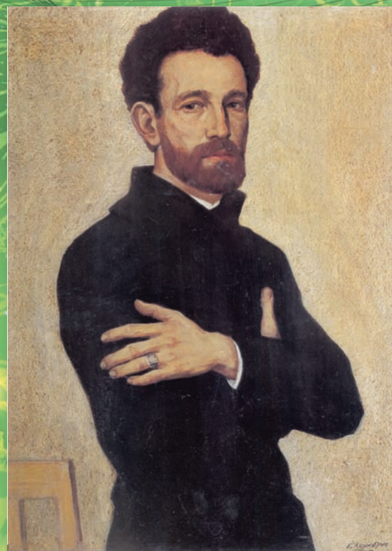
Автопортрет со скрещенными руками. 1966