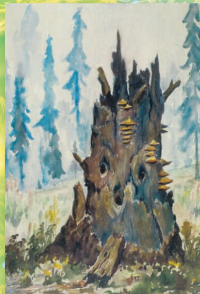
Хозяин поляны (из серии «Символы»)