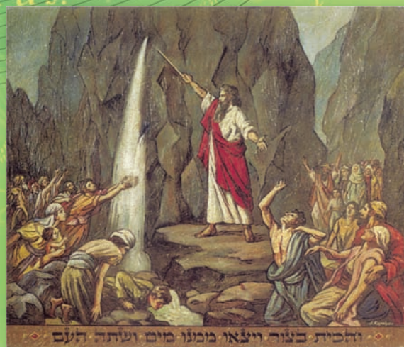
Моисей открывает источник воды в пустыне (из серии «Пасха»). 2002