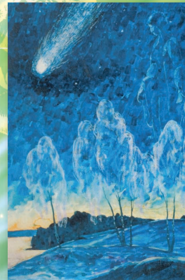
Знамение (из серии «Мир Огненный»)