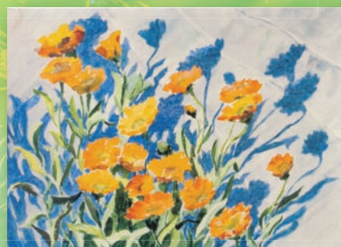
Ноготки (из серии «Мир Земле»)