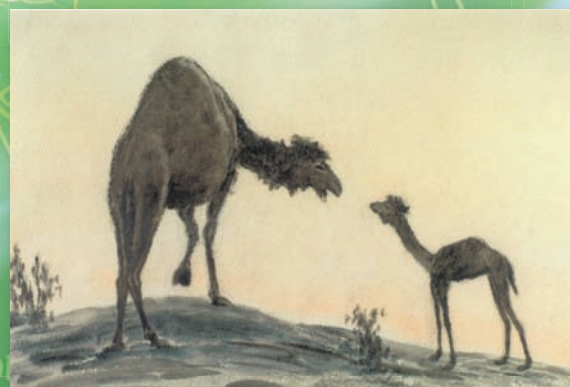
В пустыне Кара-Кум (из серии «Мир Земле»)